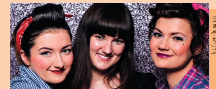
Moje makijaże w stylu pin up girl i ja po środku, szkolenie wizaż

Tak jak wspominałam już wyżej środki z EFS bardzo pomagają i minimalizują ryzyko. Sądzę, że gdybym miała założyć firmę tylko z własnych funduszy, to musiałabym z tym jeszcze poczekać, albo w ogóle by do tego nie doszło. Patrząc na zarobki, jakie można uzyskać w regionie, w którym obecnie mieszkam, nie byłabym w stanie zaoszczędzić kilkudziesięciu tysięcy na wyposażenie salonu kosmetycznego, który dzięki funduszom europejskim już istnieje, co więcej jest moją własnością i jestem z tego dumna.