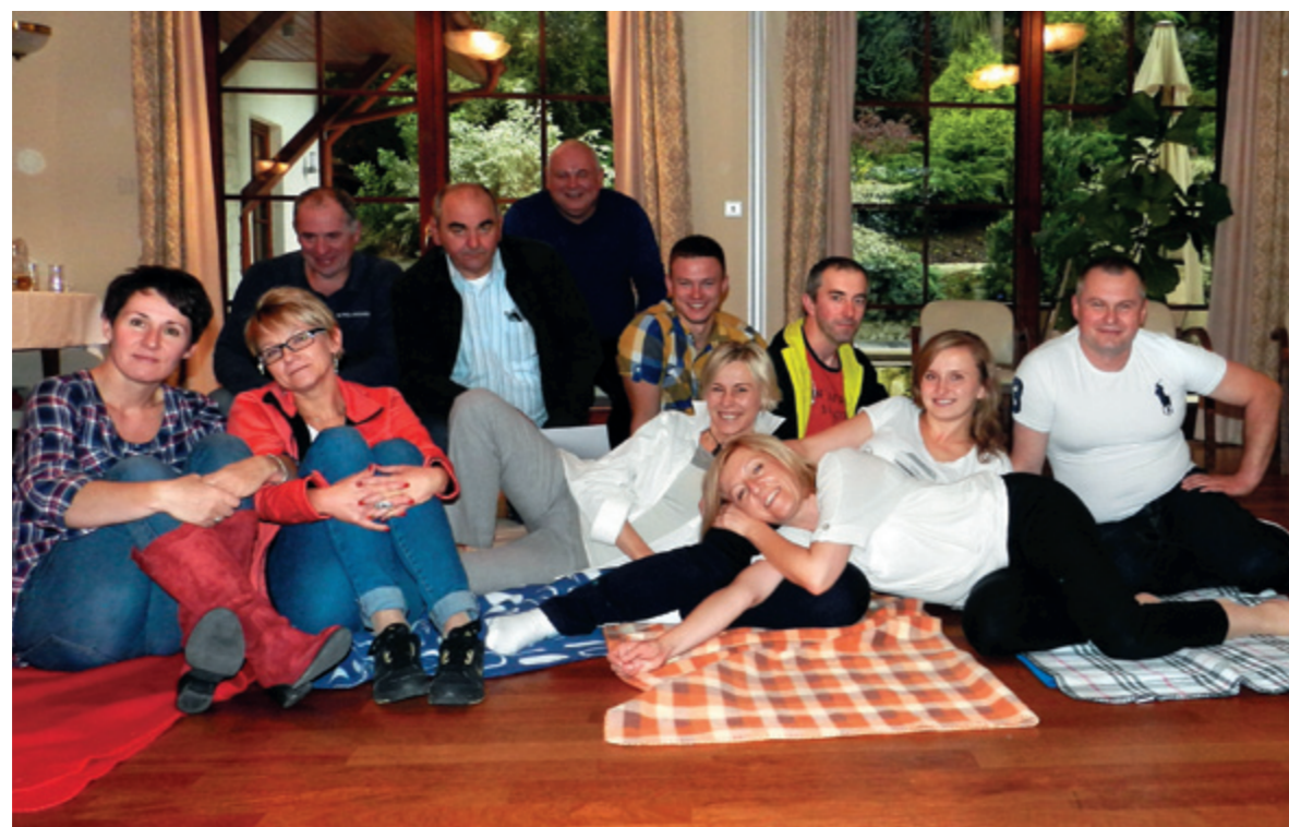
for. POL-INOWEX (matka własna)