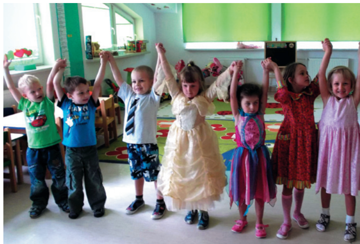
Punkt przedszkolny w Żdanowie

Inwestowanie w wiedzę oraz umiejętności najmłodszej grupy w społeczeństwie zawsze był istotnym obszarem działań EFS. Dzieci to bardzo ważny kapitał, od ich edukacji, wychowania oraz kształtowania postaw zależy przyszłość naszego regionu.