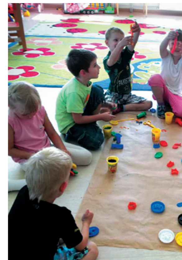
Nauka przez zabawę

Uważam, że warto starać się o pozyskiwanie środków z EFS. Dzięki takim właśnie środkom dzieci z naszej gminy uzyskały dostęp do