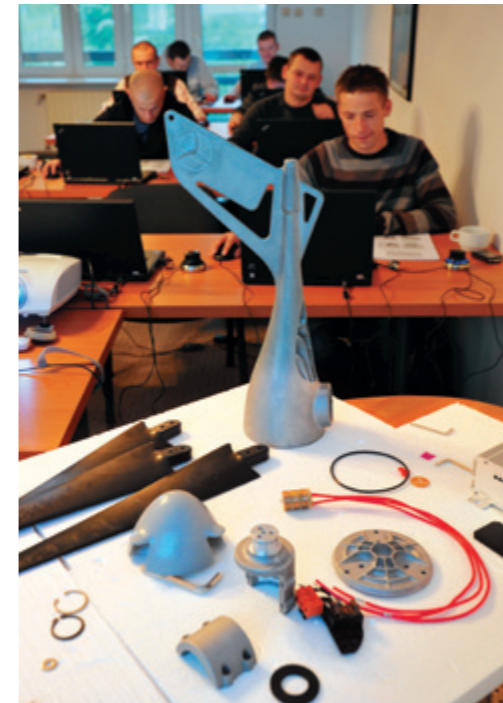
Projektant 3D maszyn energii odnawialnej, Auto&Aero Technologies Sp. z o.o. Szkolenia z budowy maszyn

Kto się uczy ten coś znaczy, Stowarzyszenie Wsparcia Społecznego Stokrotka w Kozuli. Dom pomocy społecznej