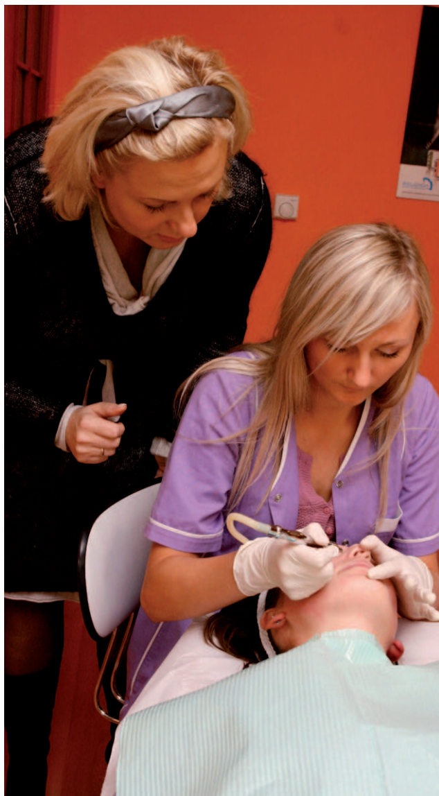
Ze szkoleń w ramach projektu „Mój styl moją szansą. Kursy kosmetyczne dla kobiet”, realizowanego w Lublinie skorzystało 50 osób.

O zasadności przyjętych planów najlepiej świadczyć będzie zainteresowanie Czytelników „Lubelskie.pl” proponowanymi szkoleniami. Warto sprawdzać, jakie ak-