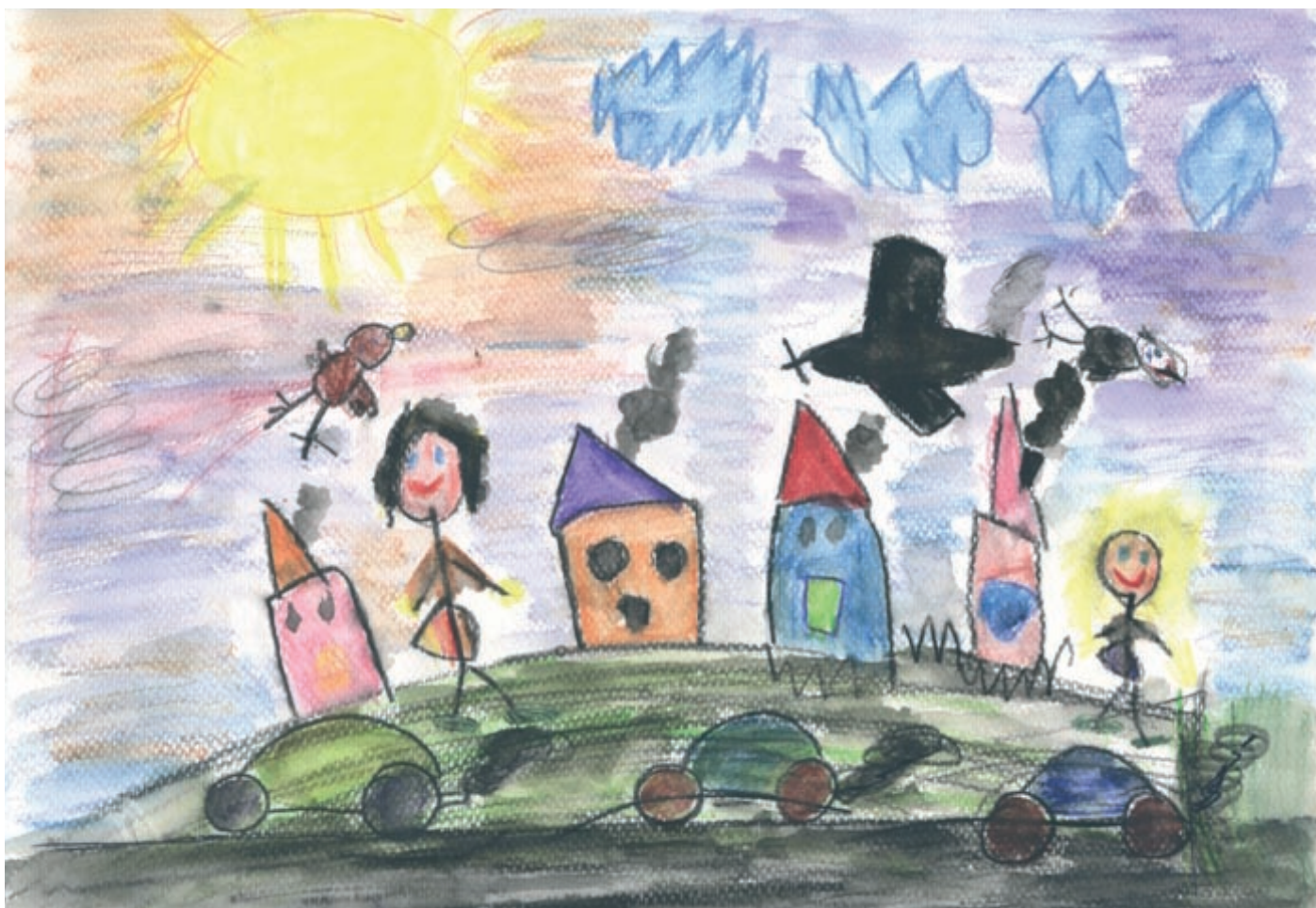
„Wszyscy podróżujemy” Zuzanna Kopycka lat 5, Przedszkole nr 18 Lublin, ul. Lipowa