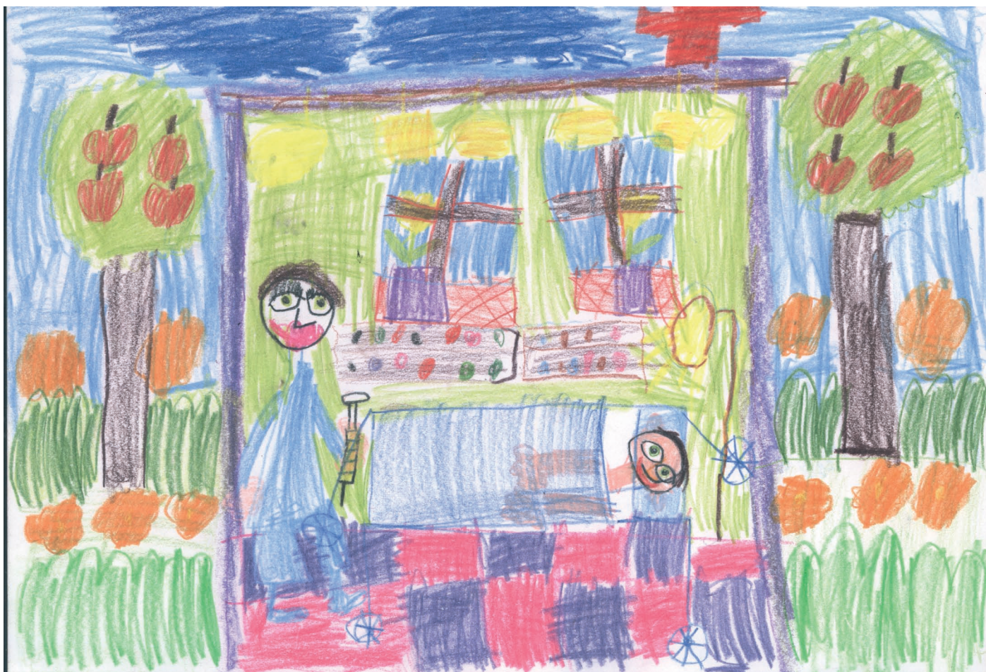
„Mama w pracy” Kinga Kowalczyk lat 6, Przedszkole nr 58 w Lublinie