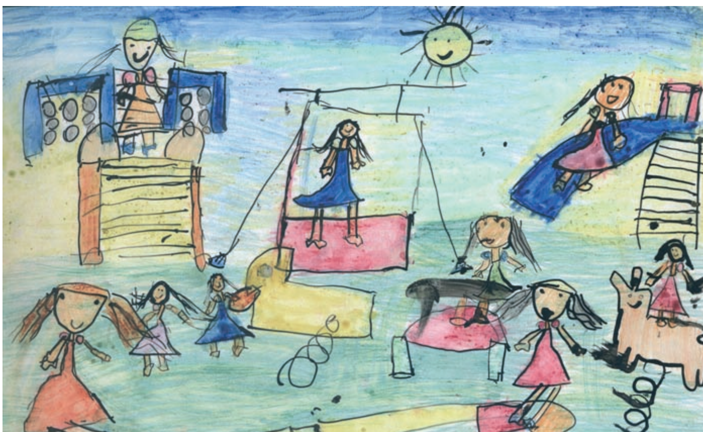
„Plac zabaw” Aleksandra Florek lat 5, Przedszkole nr 18 w Lublinie