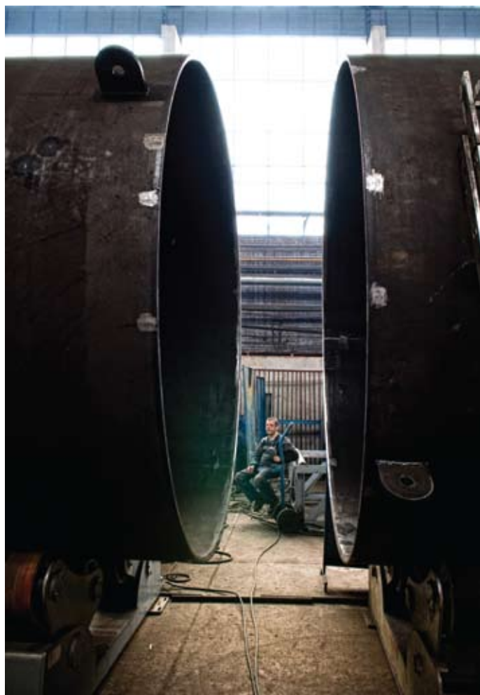
Innowacyjność dotyczy nie tylko wielkich inwestycji. Innowacyjność w PO KL to sposób na przełamywanie barier społeczno-gospodarczych.

Województwo lubelskie posiada charakterystyczne tylko dla siebie cechy. Badania i analizy, którymi dysponują instytucje ogłaszające konkursy potwierdziły, że w naszym regionie istnieje potrzeba nowych rozwiązań w obszarach zatrudnienie i integracja społeczna, adaptacyjności oraz edukacja i szkolnictwo wyższe. Innowacyjność w PO KL to swoiste-god rodzaju sposób na przełamywanie barier społeczno-gospodarczych.