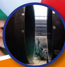
Innowacyjność pilnie poszukiwana - błędy i plany