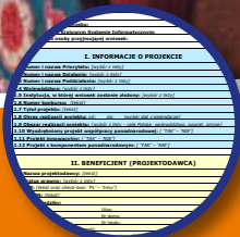
Istota zmian dokumentów programowych PO KL