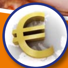
Mamy dodatkowe miliony - Krajowa Rezerwa Wykonania