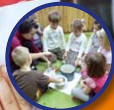
Przedszkolaki w gminie Żyrzyn